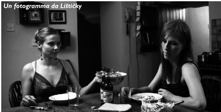
Un fotogramma da Lištičky

so quest'anno saranno proiettate durante il periodo del festival alla "Sala perla 2", allestita da questa edizione appositamente per le proiezioni della SIC e delle Giornate degli Autori, e verranno riproposte pochi giorni dopo la fine del festival in diverse sale del Veneto.