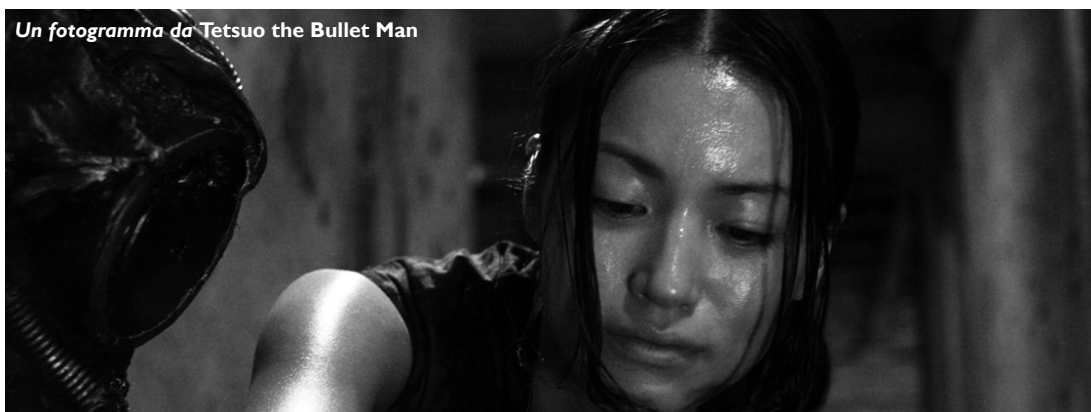
Un fotogramma da Tetsuo the Bullet Man