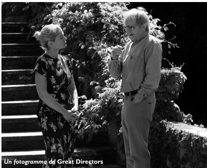
Un fotogramma da Great Directors

Per fare qualche nome: The Road di John Hillcoat, basato sul romanzo omonimo di Cormac McCarthy, che si trova a dover rendere la cupezza di una desolazione privata di ogni solidarietà umana (con pupetti al seguito) del Pulitzer 2007; si è già a lungo parlato del contestatissimo (soprattutto da Abel Ferrara) non-remake di Herzog del "Cattivo Tenente", ma se Herzog ha mai fatto uno sbaglio è probabile che lo sappia soltanto lui; ancora, il film di Francesca Comencini, tratto da Lo Spazio Bianco di Valeria Parrella; e poi l'Iran del colpo di stato del '53 in Women Without Men della videoartista Shirin Neshat, che aveva già attinto al romanzo di