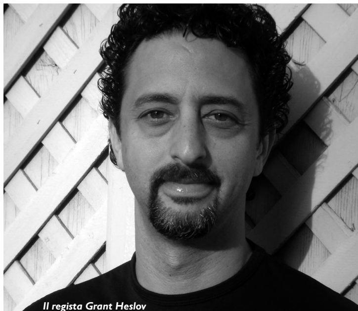
Il regista Grant Heslov

G.C.: Ora proverò a fissarla e ad entrare nella sua mente. (si concentra, ndr). Si vergogni, ho letto la sua mente! Si vergogni! C'è