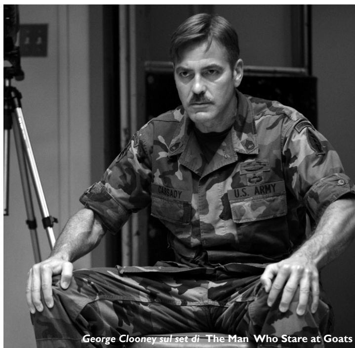
George Clooney sul set di The Man Who Stare at Goats