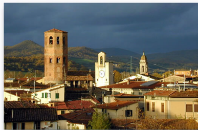
Borgo San Lorenzo Panorama

Domenica 12 Giugno: colazione in hotel. Per gli atleti: ore 08,15 appello per ingresso pista ed alle ore 08,30 partenza della gara unica all'interno del circuito. Al termine della gara, premiazione e rientro in hotel per il pranzo. Fine dei nostri servizi.