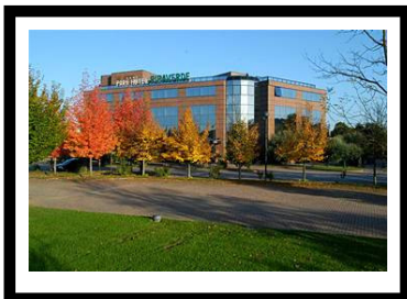
Park Hotel Ripaverde Borgo San Lorenzo